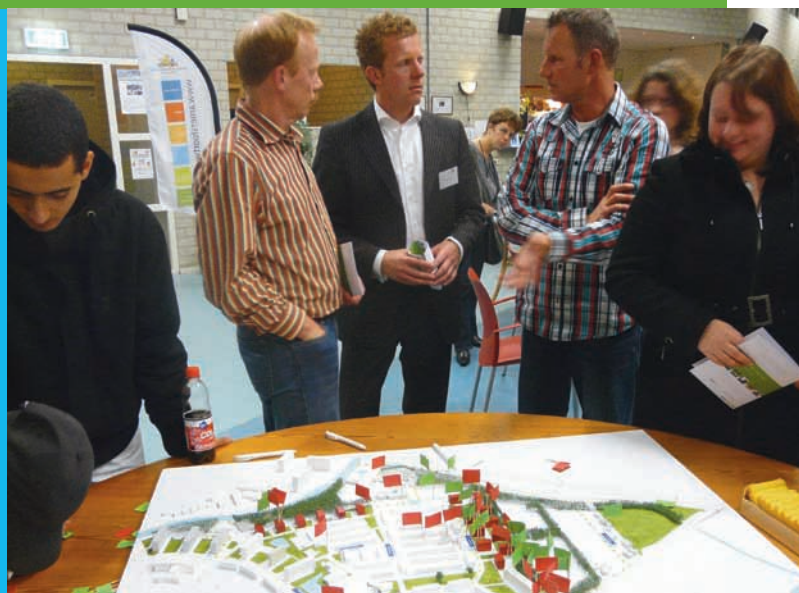
Impressie bewonersavond november 2008

Ook op de laatste bewonersavond dit voorjaar, werden door u nog suggesties gedaan. Deze zijn verwerkt in een definitief stedenbouwkundig plan, dat eind juni/begin juli aan de