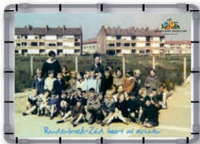
De wandeling voert langs oude foto's op plekken van nu.

Dit voorjaar vond in buurtcentrum Het Klokhuis een tentoonstelling van foto's plaats. Foto's uit het privébezit van buurtbewoners die het begin van de wijk nog hebben meegemaakt. Prachtige plaatjes van winkels uit de jaren vijftig en zestig, het schooltje aan het Euterpeplein, de slootjes voor de huizen aan de Randenbroekerweg.. De foto's maakten veel herinneringen en verhalen los bij de bezoekers van de tentoonstelling. De mooiste verhalen zijn inmiddels gebundeld in het boekje 'Randenbroek-Zuid. Buurt vol verhalen.' Ook is een wandelroute gemaakt langs foto's van gebouwen die inmiddels