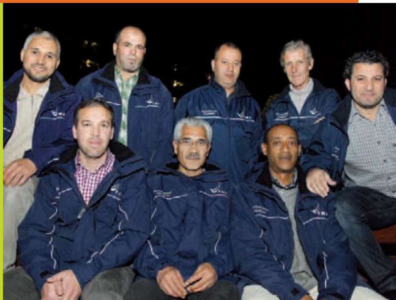
Nieuwe vaders zijn welkom bij de buurtvaders van Randenbroek-Schuilenburg.

Wilt u graag iets bespreken met een buurtvader?